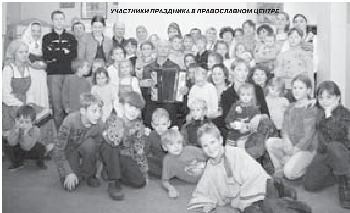
УЧАСТНИКИ ПРАЗДНИКА В ПРАВОСЛАВНОМ ЦЕНТРЕ