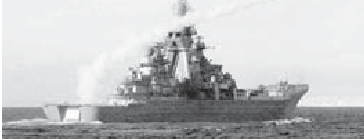
Пуск зенитной ракеты с ТАРКР "Пётр Великий"