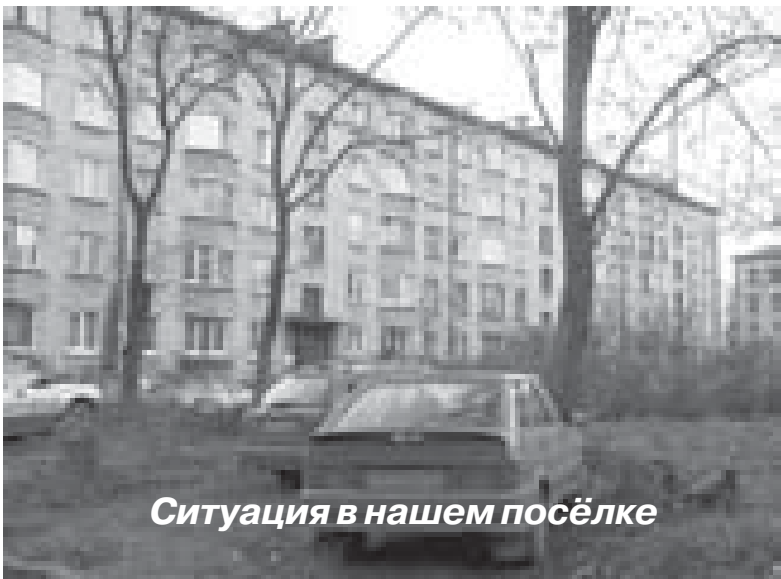
Ситуация в нашем посёлке