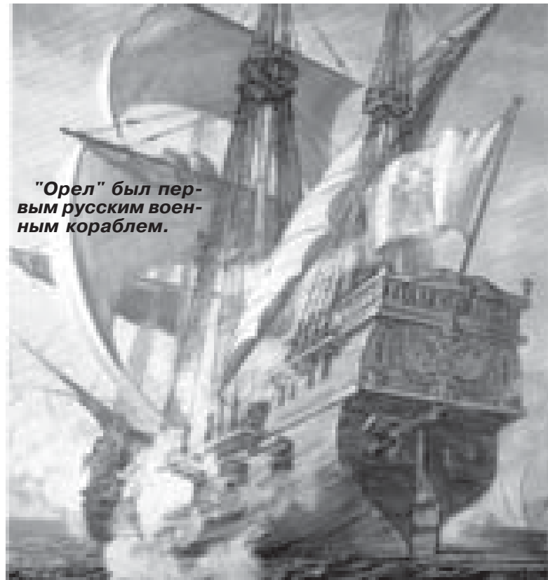
"Орел" был первым русским военным кораблем.

Известно выражение - "Петр прорубил окно в Европу". Если продолжить эту мысль, то