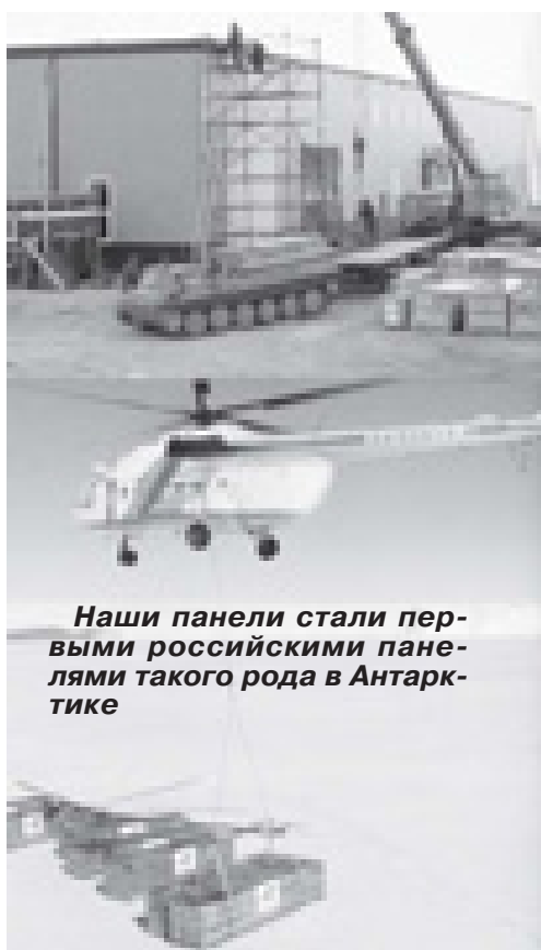
Наши панели стали первыми российскими панелями такого рода в Антарктике

Для того чтобы людям было удобно работать в таком режиме, им были созданы все усло-