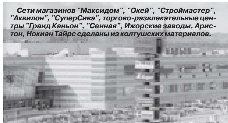
Сети магазинов "Максидом", "Окей", "Строймастер", "Аквилон", "СуперСива", торгово-развлекательные центры "Гранд Каньон", "Сенная", Ижорские заводы, Аристон, Нокиан Тайрс сделаны из колтушских материалов.