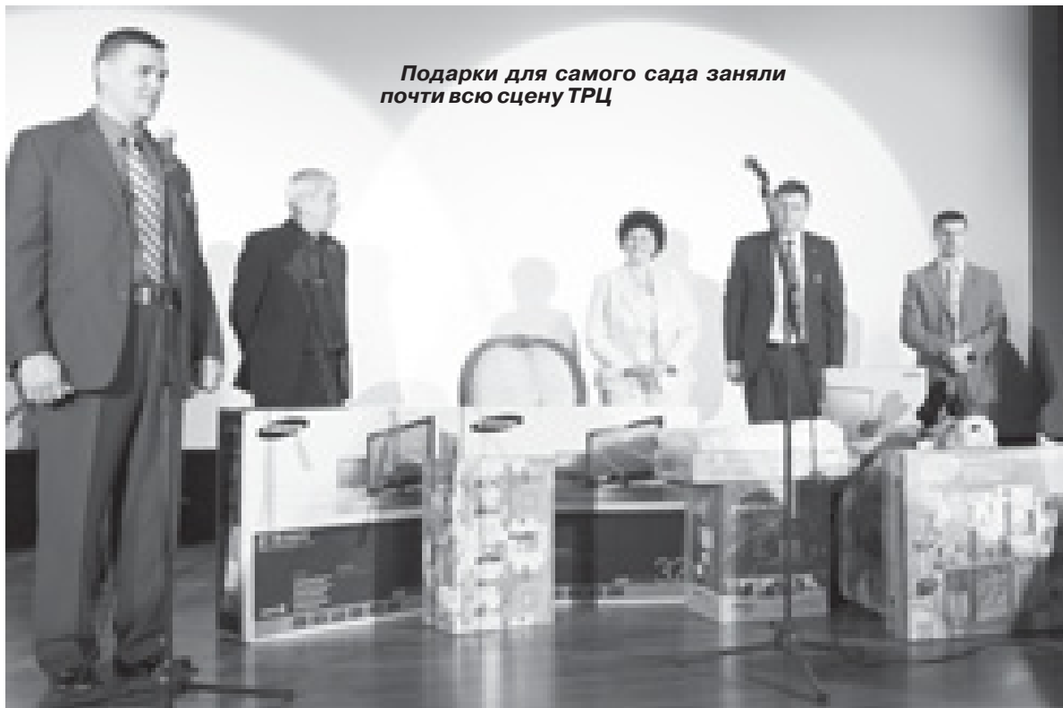
Подарки для самого сада заняли почти всю сцену ТРЦ