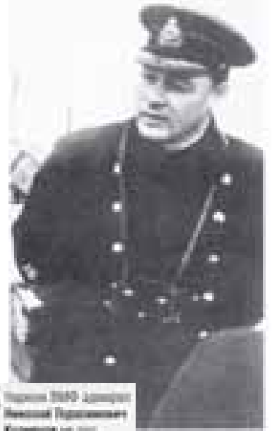
Николай Герасимович Кузнецов в звании вице-адмирала флота. 1948 г.

После смерти Сталина, развенчания его культа Николай Герасимович, как и многие, рассчитывал на перемены к лучшему. Пытался исправить ошибки, допущенные в судостроении за годы его вынужденного отсут-