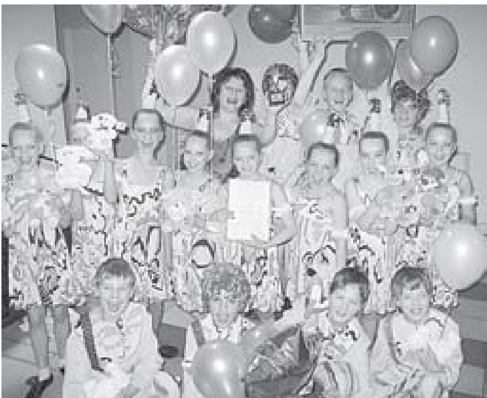
Среди множества талантливых исполнителей выступали и наши Лауреаты с танцем "Кучерявая тусовка" в гала-концерте Санкт-Петербургского открытого детского эстрадного конкурса "Восходящая звезда"

Превосходный праздник для всех, кто присутствовал 17 мая в БКЗ "Октябрьский", подарили детские творческие коллективы. Среди множества талантливых исполнителей выступали и наши Лауреаты с танцем "Кучерявая тусовка" в гала-концерте Санкт-Петербургского открытого детского эстрадного конкурса "Восходящая звезда". Замечательный огромный зал, множество зрителей, именитое жюри создавали волнующую атмосферу для всех участников концерта. Честно говоря, для родителей, чьи дети выступали, само участие в большом концерте на прославленной сцене БКЗ "Октябрьский", лучшей не только в Санкт-Петербурге, но и в России, где блистают настоящие звезды, уже важное событие. Надежда на победу теплилась в душе, но мы видели, какие у нас соперники, соревновались равные. У жюри была серьезная и сложная задача - определить победителя. Колтушские зрители, которых в этот день в зале было около двухсот человек, всегда считают "Радугу" лучшей, но оценка профессионального компетентного жюри - это другой уровень.