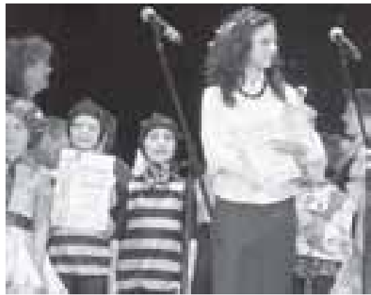
Ансамбль награжден сертификатом лауреата 2-й степени и сертификатом лауреата 3-й степени, хрустальным Кубком, а также участникам "Радуги" вручили сладкие призы, сертификат от театрального ателье "Классика" и путевку в детский оздоровительный лагерь "Колосок" Белгород-Днестровского района Одесской области на берегу Черного моря.

Во время школьных весенних каникул с 26 по 29 марта 2008 года в Санкт-Петербурге проходил 2-й Открытый фестиваль-конкурс хореографического искусства "Славянский Кубок".